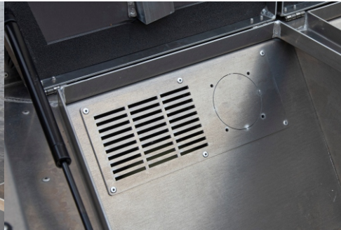
Keulalaatikon sisällä ilmanvaihtoritilässä valmiina läpivientien paikat