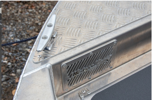
Pilssitilan ilmanvaihtoritilän kautta mm. keulakoneen asennus vaivatonta.