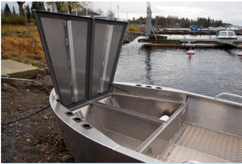
Keulassa suuret vesitiiviit säilytystilat kahden luukun alla.