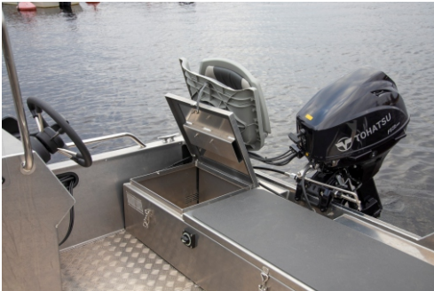
Takalaatikko jaettu kahteen osioon, kummassakin luukussa kaasujouset.