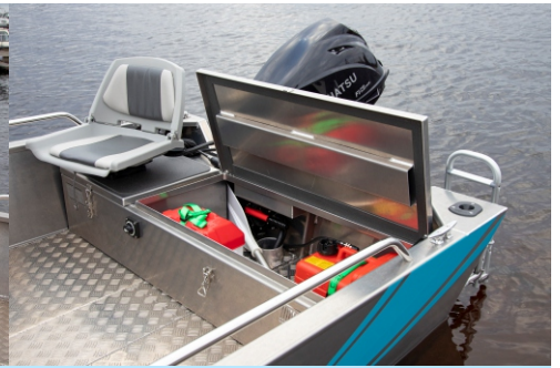
Takalaatikossa kaksiosainen säilytystila, pulpettiversiossa sähköjärj. vakiona.