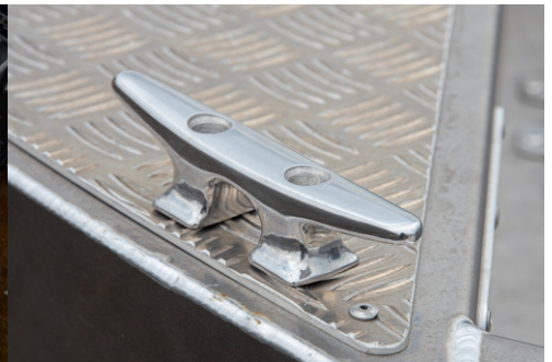
Vakiona käyttöä kestävätkä pollarit 4 kpl sekä liukuestekuvio myös keulassa.