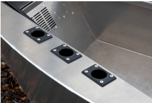
Vapatelineet 6 kpl vakiona keulaosassa.